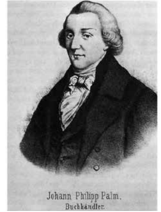
بورترية لبالم من مجلة "فرايا"، العام 1865